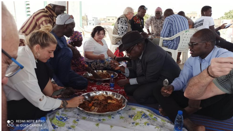
Mission d'études pour installer des panneaux photovoltaïques au bénéfice d'écoles primaires, mais aussi comparaison des gestes de protections contre la transmission du COVID.