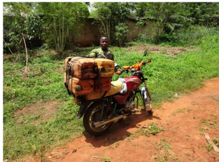
Le livreur de carburant « Nigérian » en moto-citerne