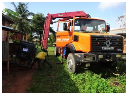
Le moyen de manutention